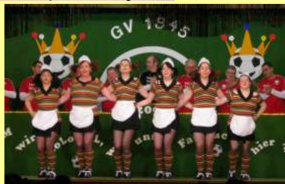
Fastnacht BallermannParty 2006