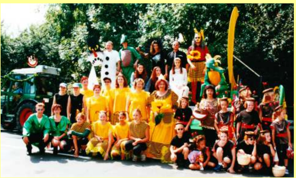
Pfeddersheimer Marktumzug Tabaluga 2002