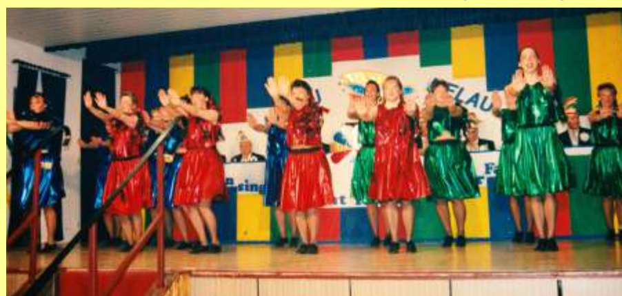
Fastnacht Grease 1998