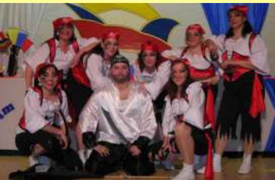
Fastnacht Piraten 2008